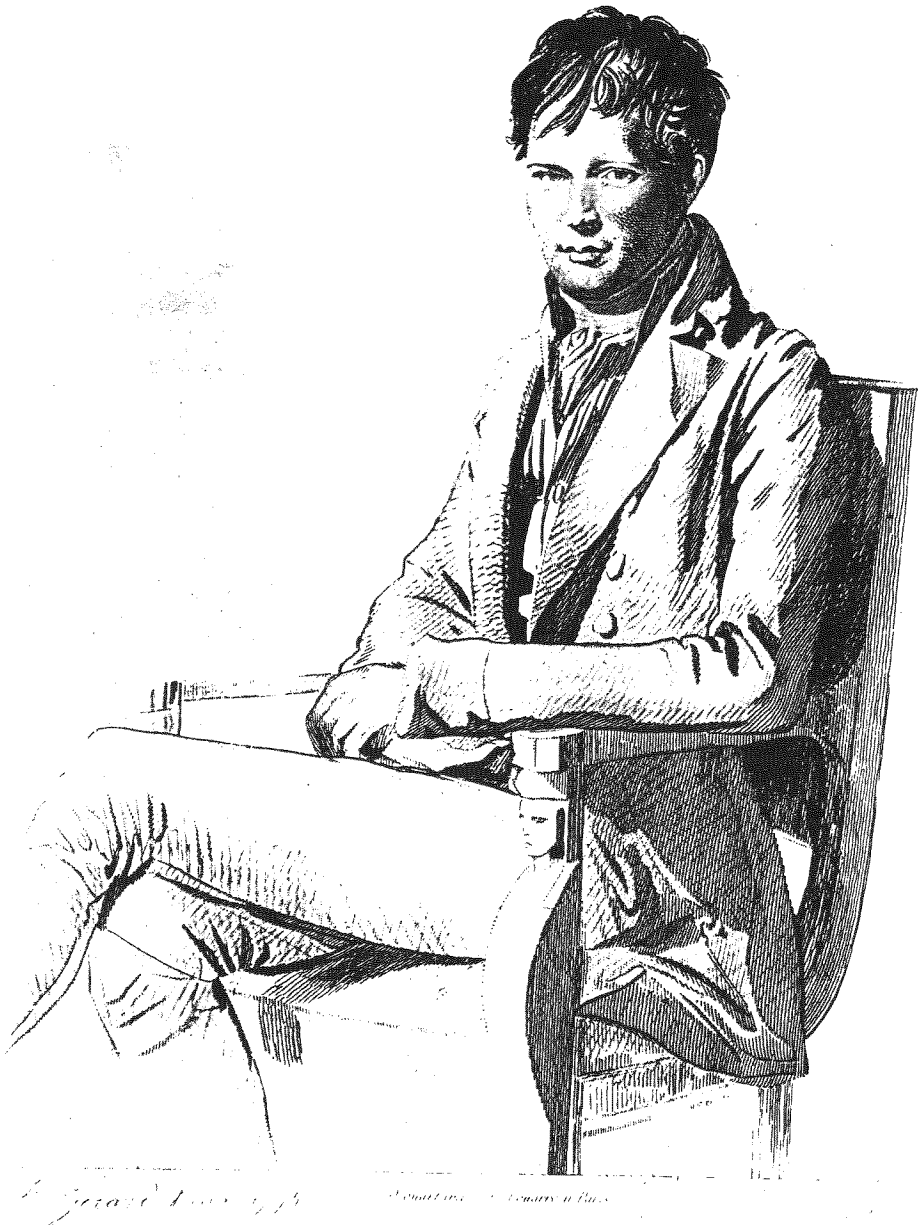
Abb. 1 Alexander von Humboldt (1769 – 1859) zur Zeit seines Helgoland-Besuchs (Bildnis von F.P. Gerard 1795)

interessanter war als heute. Die westliche Klippen waren noch durch die male- rischen Stacks (es gab seinerzeit mehrere, heute nur noch die „Lange Anna“) und Gatts (natürliche Felsbögen) sowie Slaps (felsige Einbuchtungen) ge- kennzeichnet. HUMBOLDT hat auch selbst noch den monumentalen (alten) Mönch gesehen, bevor dieser durch Ansturm der Wellen im Jahre 1939 zu- sammenstürzte, ebenfalls den großartigen Felsbogen von Möhrmergatt. Die- ser stürzte im Jahre 1865 ein. Schon 30 Jahre nach HUMBOLDTs Besuch begann zaghaft der Fremdenverkehr auf Helgoland im Rahmen der Bemühun- gen, Stationen für die Meeresheilkunde zu gewinnen. In einem recht amüsan- ten Bericht über eine Vergnügungstour von Hamburg nach Helgoland von Carl REINHARDT aus der Zeit um 1850 werden die physischen und natürlichen Schönheiten der Insel und die seltsamen Verhaltensweisen der Einheimischen sowie der Touristen kurz nach Eröffnung des ersten Hotels durch SIEMSEN im Jahre 1826 geschildert. Diese Quelle schließt einen recht aufschlußreichen Teil über die Popularisierung der Naturgeschichte der Insel mit einer allgemein- verständlichen Beschreibung der Muscheln, Algen, Fische und Fossilien aus den Kalkfelsen der Düne ein. Wie schon oben erwähnt, fand besonders die Meeresbiologie in der Öffentlichkeit ein breites Interesse.